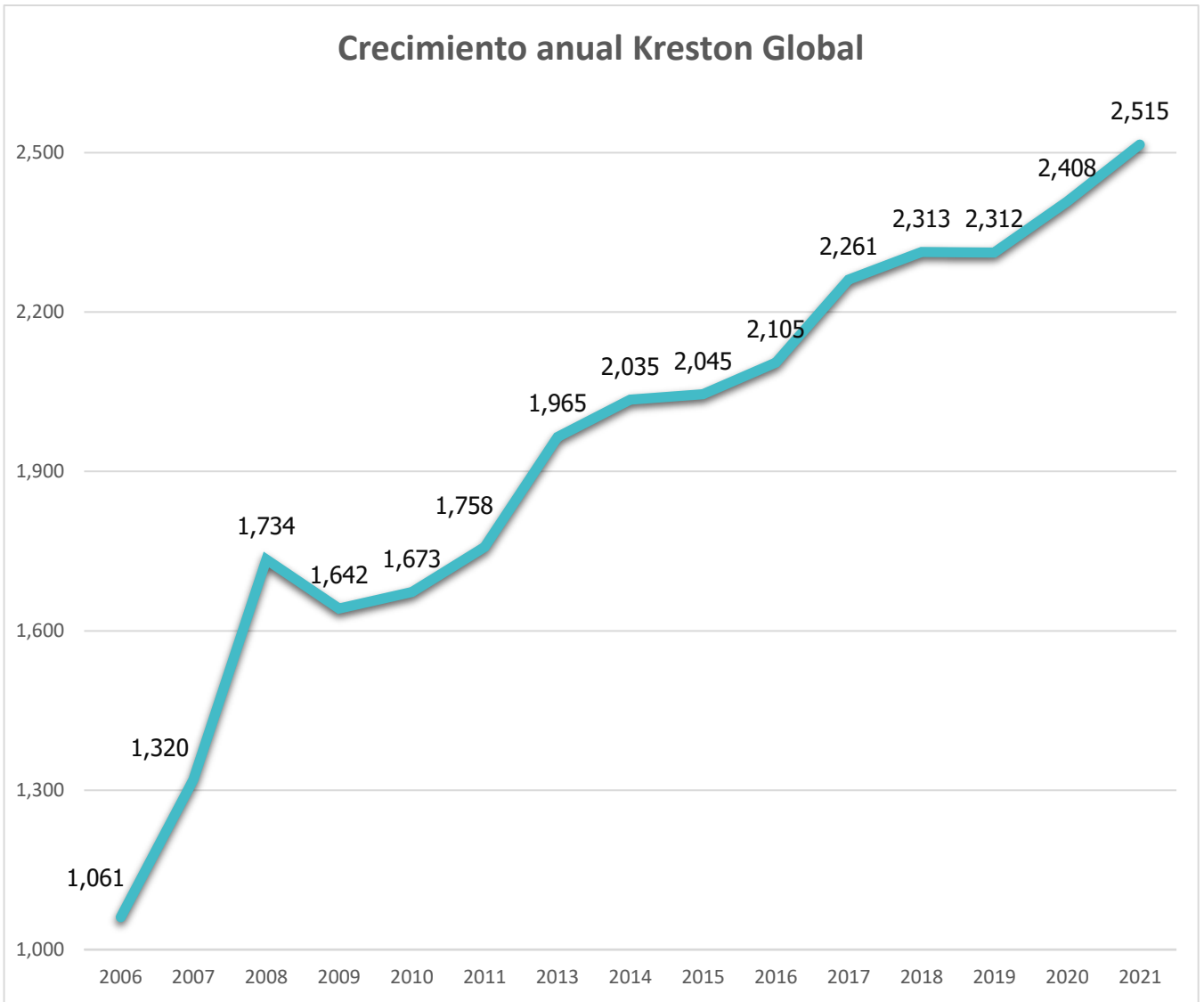
Crecimiento anual Kreston Global